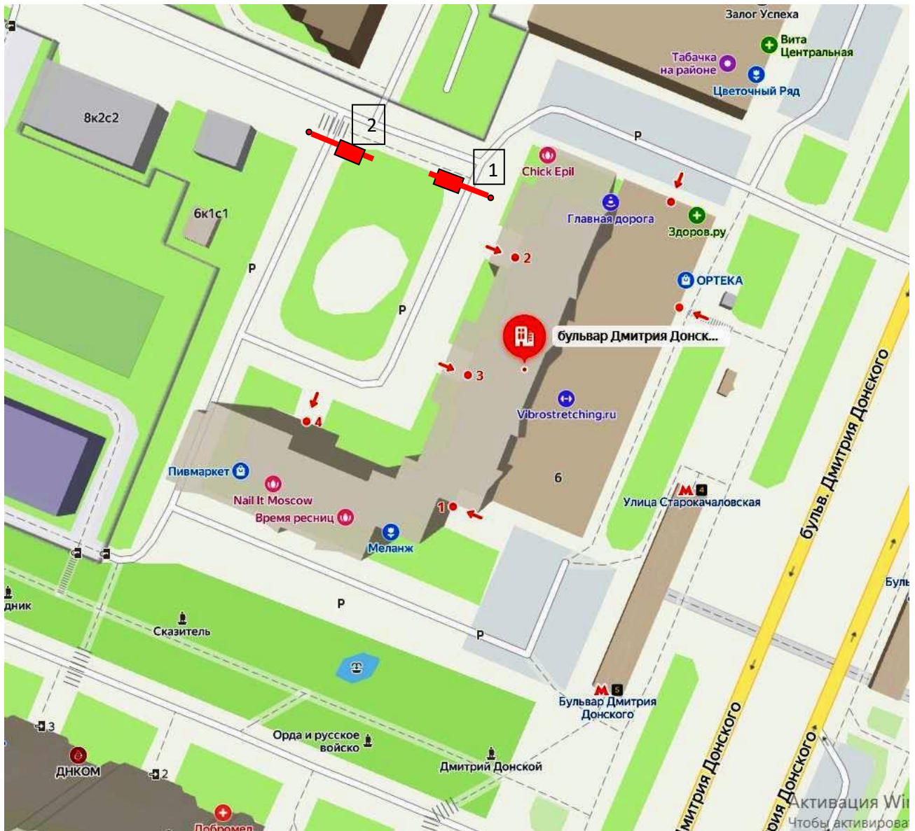
Схема размещения шлагбаумов:

1. Место размещения шлагбаумов: г. Москва, бульвар Дмитрия Донского, д. 6, при въезде на придомовую территорию.